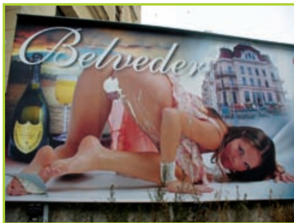
Reklama, která v roce 2009 jako první získala od veřejnosti anticenu Sexistické prasátčko.