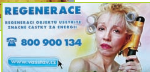
Reklama, která v roce 2010 získala anticenu Sexistické prasátečko od odborné poroty.